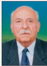
Γράφει ο Βασίλης Χρ. Καραγιάννης

Με τη μεταπολίτευση και επί κυβερνήσεως Κωνσταντίνου Καραμανλή νομιμοποιήθηκε και αναγνωρίστηκε το ΚΚΕ ως νόμιμο κόμμα και με την αναγνώριση αυτή ομαλοποιήθηκε η πολιτική ζωή στη χώρα μας και η Ελλάδα μπήκε στον σωστό δρόμο της ομαλότητας, της δημιουργίας, της ισονομίας και της πολιτικής ελευθερίας. Τα στελέχη του ΚΚΕ που βρίσκονταν στο εξωτερικό επέστρεψαν στη χώρα μας, μαζί με τον Γενικό Γραμματέα του, τον συγχωριανό μας Χαρίλαο Φλωράκη.