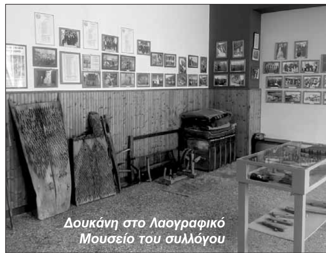
Δουκάνη στο Λαογραφικό Μουσείο του συλλόγου

Γέμιζαν δηλαδή το δικούλι με τα θρυμματισμένα άχυρα και το πέταγαν ψηλά (το ξανεμίζαμε) και τα υπόλοιπα τα έκανε ο αέρας και η βαρύτητα.