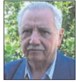
Γράφει ο Παναγιώτης Αγ. Κατσιούλας