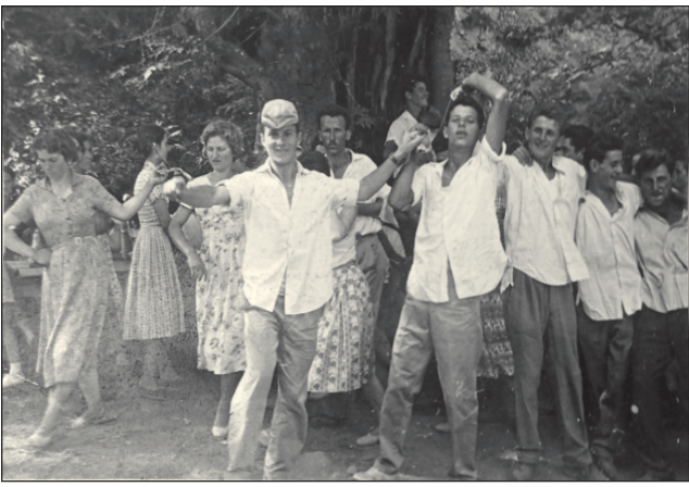
Χορός στο πανηγύρι του Αϊ - Λιως στις αρχές της δεκαετίας 1960