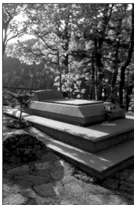
Ο τάφος - μνημείο του Χ. Φλωράκη στο αγνάτι του Αι -Λια στο Παλιοζωγλόπι