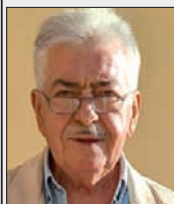
Γράφει ο Φώτης Π. Νασιάκος*

Τα χριστουγεννιάτικα κάλαντα σ' ένα χωριό των Αγράφων. Στην Ραχούλα (Ζωγλόπι), το χωριό μου.