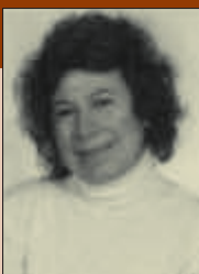
Γράφει η Λαογράφος Σούλα Τόσκα-Κάμπα