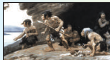
Κατοικία προϊστορικών ανθρώπων