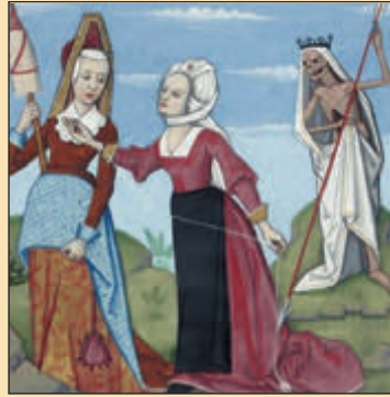
Οι τρεις μοίρες: Κλωθώ, Λάχεσις, Άτροπος

Σύμφωνα με τον Ησίοδο (8ος αι. π.Χ.) οι μοίρες που αποφάσιζαν για την τύχη (καλή ή κακή) του ανθρώπου ήταν τρεις: Η Κλωθώ, η Λάχεσις και η Άτροπος και είχαν επικεφαλής τον Δία. Η Κλωθώ κλώθει, δηλαδή γνέθει το νήμα της ζωής κάθε ανθρώπου. Η Λάχεσις μοιράζει τους κλήρους, τους λαχνούς, ό,τι έλαχε στον καθένα. Και η Άτροπος, που η απόφασή της δεν έχει τροπή, δεν αλλάζει, κόβει το νήμα και τερματίζει τη ζωή.