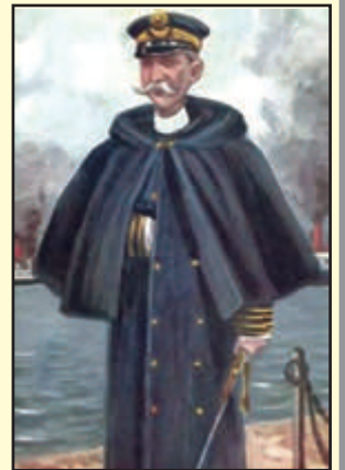
Ο θρωλικός αρχηγός του Ελληνικού στόλου του Αιγαίου, Υποναύαρχος Παύλος Κουντουριώτης