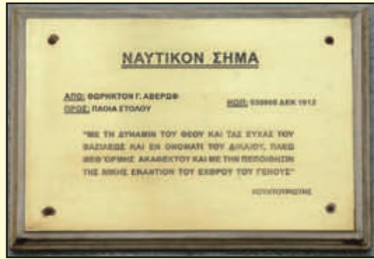
Το ιστορικό μήνυμα του Κουντουριώτη που σώζεται στο Αβέρωφ

Καθώς η ταχύτητα της θωρηκτής μοίρας τύπου Ύδρα ήταν μικρή (14 κόμβοι), ο Αβέρωφ υπερφαλάγγισε τον εχθρό μόνος του και ανάμεσα σε πυκνά πυρά του τουρκικού στόλου και των απέναντι φρουριών έφτασε σε απόσταση 2.850 μ. από τον αντίπαλο. Οι Οθωμανοί όταν κατάλαβαν ότι ο ελιγμός θα εκτελούνταν με απόλυτη επιτυχία, έκαναν διαδοχική στροφή 160 μοιρών και μπήκαν με φοβερή αταξία ξανά στα Στενά, κάτω από την κάλυψη των επάκτιων