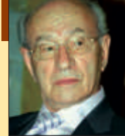
Γράφει ο Άγγελος Ζαχαροπούλος, Επίτιμος Διευθ. της Ευρωπαϊκής Επιτροπής πρ. Γενικός Διευθ. του Υπουργείου Γεωργίας μέλος της Κεντρικής Επιτροπής Διαπρωτεύσεων για την ένταξη της Ελλάδας στην ΕΟΚ (ο τελευταίος επίσημ).

Το Σεπτέμβριο του 1944 έφυγαν οι Γερμανοί από την Καρδίτσα. Αμέσως άνοιξαν τα σχολεία. Κατεβήκαμε χαρούμενοι από τα ορεινά χωριά μας για να ξαναβρούμε τα θρανία που είχαμε εγκαταλείψει για μεγάλα χρονικά διαστήματα, όσο διαρκούσε η κατοχή.