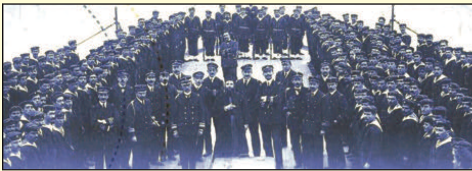
Το πλήρωμα του Αβέρωφ

Στη ναυμαχία της Έλλης συμμετείχαν τέσσερα Οθωμανικά θωρηκτά (Ασάρ Τερήκ, Μεσουδιέ, Τουργκούτ Ρείς, Χαϊρεντίν Μπαρμπαρόσα), το καταδρομικό Μεντητιέ που κινήθηκε νοτιότερα από τα θωρηκτά, πέντε αντιτορπιλικά και ένα νοσοκομειακό πλοίο που ακολουθούσαν το Μεντζητιέ.