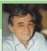
Γράφει ο Μάρκος Παππάς

Το χωριό μου τον Εμφύλιο τον πλήρωσε με αρκετά θύματα, όπως κι όλα σχεδόν τα χωριά και η Ελλάδα ολόκληρη, γιατί εκείνη την εποχή οι άνθρωποι είχαν χωριστεί σε Ελασίτες (αντάρτες του Ε.Λ.Α.Σ.) 1 και Μάυδες (Μ.Α.Υ.) 2 . Η διχόνοια και η εκδίκηση ήταν αιτία να χαθούν αρκετοί χωριανοί, φυσικά κι από τα δύο στρατόπεδα. Η διχόνοια, αυτή η αιώνια κατάρα, αυτή η αγιάτρευτη πληγή του Έθνους που παραμένει πάντα ανοιχτή. Η διχόνοια, αυτό το μεγάλο ελάττωμα της φυλής μας που πυροδότησε