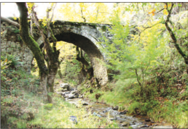
Το γεφύρι στα Χτίσματα απευθύνει SOS (στη σελ. 7)