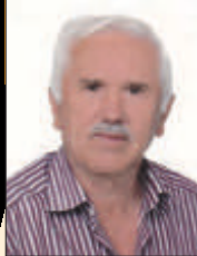
Γράφει ο Γεώργιος Αθ. Κλήμος

Αντικείμενο της έρευνάς μας αυτή τη φορά, όπως υποδεικνύει και ο τίτλος της εργασίας μας, τα βιβλία που αφορούν τον πρώην Καποδιστριακό Δήμο Ιτάμου (ΦΕΚ 244/1997). Ως γνωστόν ο παραπάνω Δήμος συγκροτήθηκε με έδρα το Καλλίθηρο, και τα χωριά: Ραχούλα, Καταφύγι, Καστανιά - Μούχα, Αμάραντος, Σαραντάπορο - Νεραίδα, Καραπλάσι και Αμπελικό. Στην έρευνά μας καταγράφουμε τους συγγραφείς των παραπάνω οικισμών που έλκουν την καταγωγή από αυτά και έχουν γράψει ένα ή περισσότερα αυτοτελή βιβλία για την περιοχή (Ιστορία - Λαογραφία - Δημοτικό Τραγούδι κλπ). Στα παραπάνω βιβλία δεν