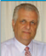
Γράφει ο Γιώργος Δ. Κατσιούλας

"Πάντες άνθρωποι του ειδέναι ορέγονται φύσει" (Αριστοτέλης). Δηλαδή, όλοι οι άνθρωποι από τη φύση τους είναι πλασμένοι να τους αρέσει η μάθηση. Αυτή είναι μια μεγάλη αλήθεια, διότι ο άνθρωπος από τη μακρινή εποχή που ζούσε στις σπηλιές, ερευνώντας και μαθαίνοντας έφτασε στην εποχή μας, δημιούργησε επιστήμη, ιστορία, πολιτισμό και έφτασε ως τα άστρα. Άλλο ότι οι ανακαλύψεις του, εξαιτίας της κακής χρήσης τους, κινδυνεύουν να αφανιστούν, τι μέχρι τώρα δημιουργήσε (πυρηνικός πόλεμος). Στο άρθρο που ακολουθεί θα