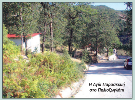
Η Αγία Παρασκευή στο Παλιοζωγλόπι

και να κατείχαν ήσαν άνθρωποι αγνοί, άδολοι, άνθρωποι της προσφοράς που δεν ζητούσαν τίποτε άλλο παρά να προσφέρουν και να συνδέσουν το όνομά τους με την τοπική ιστορία του χωριού μας. Άλλοι βέβαια τους παρέσυραν είτε ήταν κρατικοί παράγοντες είτε κατείχαν μια δεσποζόουσα θέση στην κοινωνία. Τα γράφω αυτά διότι αποτελούν μέρος της τοπικής ιστορίας και κυρίως τα γράφω για τους νέους οι οποίοι έπειτα από δεκαετίες θα αποτελούν την άρχουσα τάξη του χωριού μας και θα πρέπει να προσέχουν και να ασκούν τη διοίκηση λαμβάνοντας υπ' όψη όλους τους παράγοντες. Το άλσος της Αγίας Παρασκευής Αρχίζω από το άλσος της Αγίας Παρασκευής όπου τα κα-